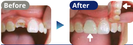
破折歯の修復 (来院1回※応急処置・所要時間20分)

治療内容 転倒による前歯破折にて、ご来院。 消毒を行いレジン充填にて破折部分を修復。